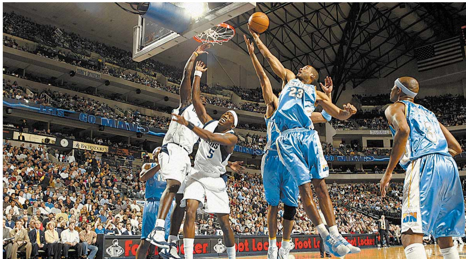
Basketballspiel im American Airlines Center in Dallas: Rund um die Arena entsteht mit dem Geld deutscher Anleger ein neuer Wohn- und Geschäftskomplex

► Objekt Der größte Anziehungspunkt in Dallas sieht aus wie ein 100 Jahre alter Bahnhof, ist aber eine moderne Sportarena: das American Airlines Center. Im Sommer 2001 fertig gestellt, zieht sie bei rund 240 Veranstaltungen im Jahr mehr als drei Millionen Besucher an. Zuschauer magnetisch sind die Basketballspiele der Dallas Mavericks mit dem deutschen Ausnahmetalent Dirk Nowitzki. Noch ist die Arena durch ein Brachgelände von der Innenstadt getrennt. Nun entsteht dort ein Stadtteil mit Wohnhäusern und Bürogebäuden. Dazu gesellen sich außergewöhnliche Hotels und Geschäfte. Anleger beteiligen sich über den Fonds an acht verschiedenen Objektgesellschaften, hinter denen jeweils eines der Gebäude steht. Insgesamt entstehen 86 000 Quadratmeter Bürofläche, 26 300 Quadratmeter Einzelhandel, rund 620 Eigentumswohnungen und Apartments, 252 Hotelzimmer und 130 Suiten sowie eine Großbildanlage für Werbekunden.